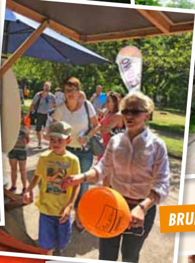
BRUNNENFEST BAD DÜRRENBURG