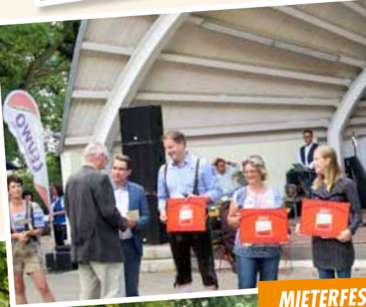
MIETERFEST IM KURPARK