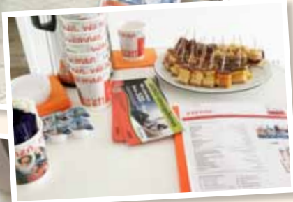
JAHRESHAUPTVERSAMMLUNG NACHBARSCHAFTSHILFE E.V.