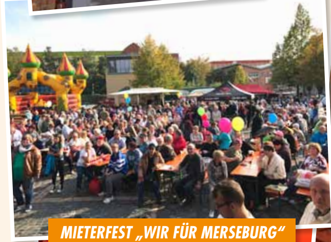
MIETERFEST „WIR FÜR MERSEBURG“