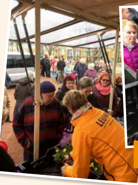
FRÜHLÜHERAKTION BAD DÜRRENBURG/MERSEBURG